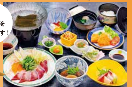
寒ブリ御膳 解体実演ショー付 @3,300(税込)