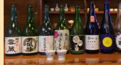
10種の地酒試飲(季節により銘柄変更有)