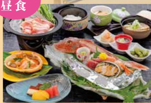
氷の船盛御膳 アワビ入り蟹甲羅(和) @2,750(税込) (解体実演ショーは別途)