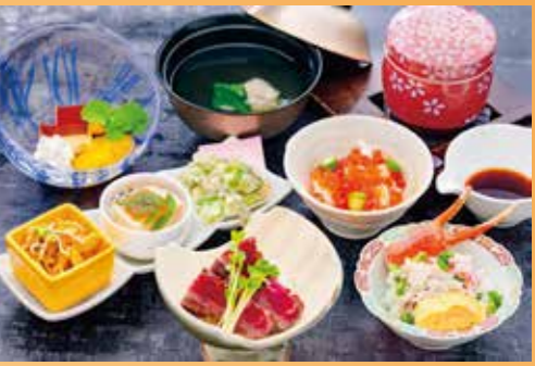
ズワイガニ・イクラ・山古牛御膳 @2,750(税込) (解体実演ショーは別途)