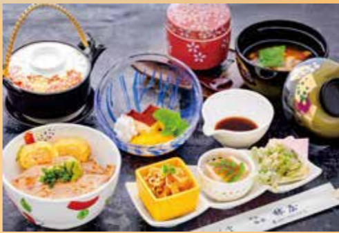
のどごろひつまぶし御膳 @2,750(税込) (解体実演ショーは別途)